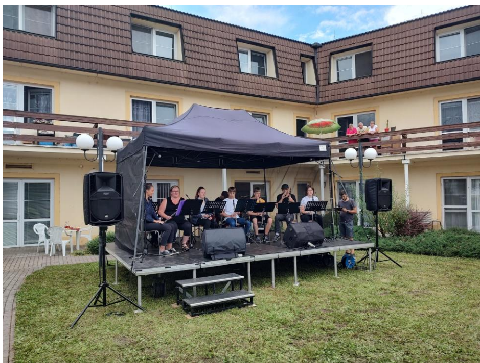
Pečecký Small band (ZUŠ Pečky)