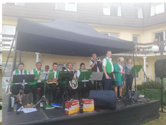
dechová kapela Polabská Blatanka