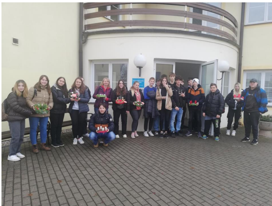
Výrobky k prodeji na adventní trhy od klientů Senior klubu