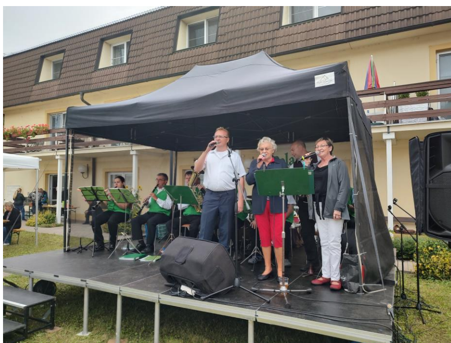
kapela Polabská Blat'anka